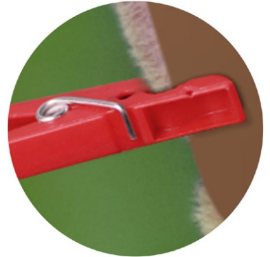
Befestigung mit Wäscheklammern